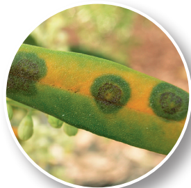
Occhio di pavone