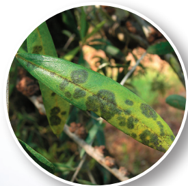
Occhio di pavone