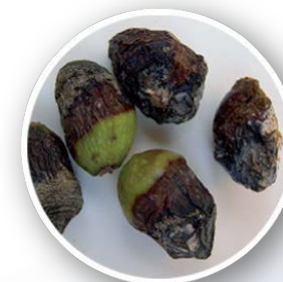
Lebbra o Antracnosi

Nelle prove sperimentali condotte sia da Bayer CropScience che da Enti di ricerca ed Università, Flint Max , impegnato alle dosi e nella modalità riportata in etichetta, ha mostrato un grado di efficacia eccellente nel controllo dell'occhio di pavone e della Lebbra o Antracnosi.